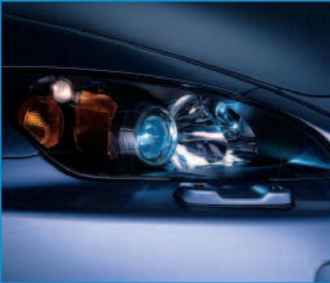
Protégés par une glace lisse résistante aux chocs, les phares avant au xénon améliorent la visibilité.