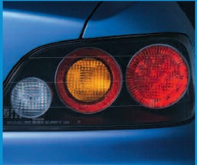
Un "look" sportif à l'arrière avec les feux "LED" à haute intensité.