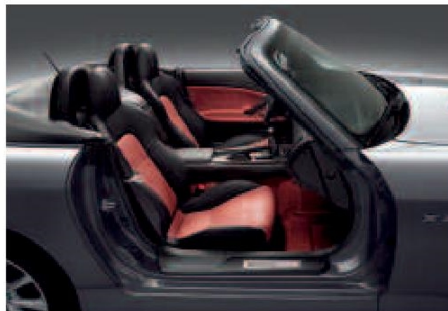
Cuir rouge et noir disponible avec les couleurs Noir Berlina, Argent Silverstone et Gris Lunaire.