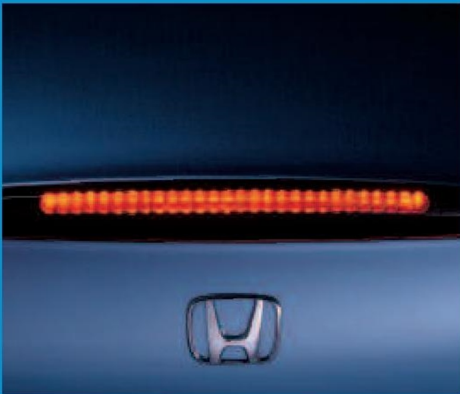
Monté en position haute à l'arrière de la Honda S2000, le feu stop à diodes, constitue un élément supplémentaire de sécurité. Il s'intègre de manière très harmonieuse aux lignes du capot de coffre.