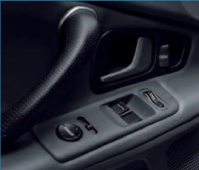
Les commandes électriques des vitres et des rétroviseurs extérieurs sont judicieusement regroupées dans le panneau de portière, côté conducteur.