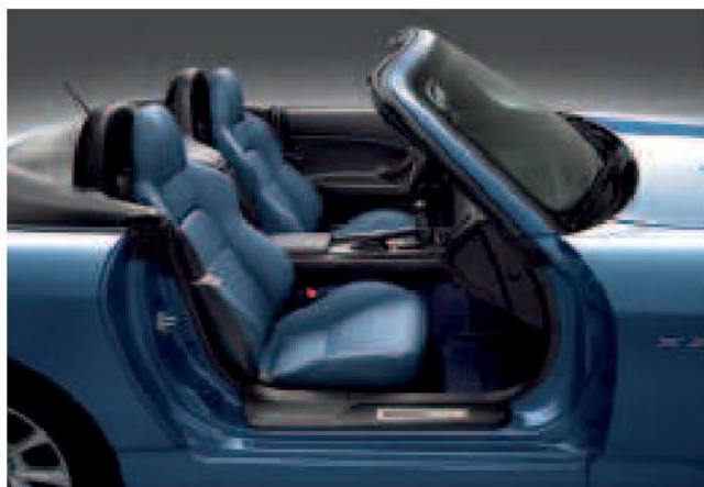
Cuir bleu disponible avec le Bleu Nürburgring.