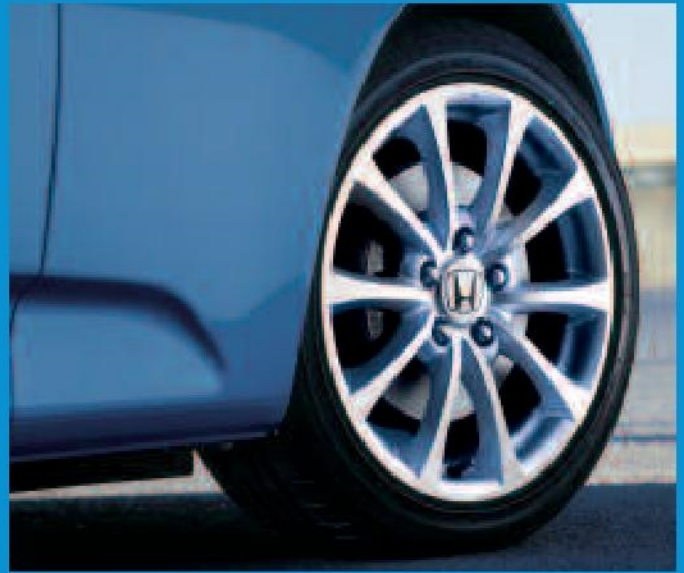
Les impressionnantes roues en alliage de 17 pouces ne sont pas seulement belles, elles contribuent aussi à accroître l'adhérence.