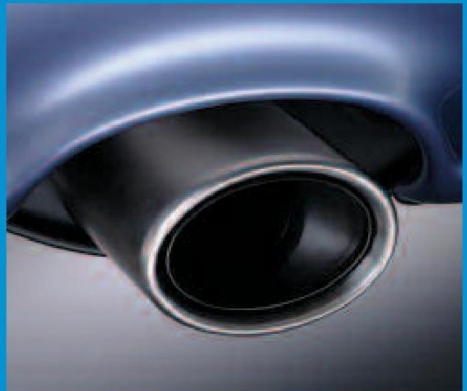
La finition chromée de la canule d'échappement attire le regard et apporte une note saisissante au "look" sportif de la voiture.