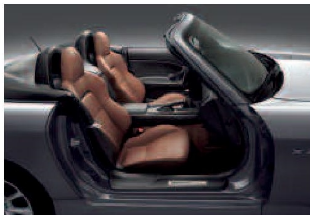
Cuir tanneur disponible avec les couleurs Noir Berlina, Gris Lunaire, Bleu Océan et Burgundy.