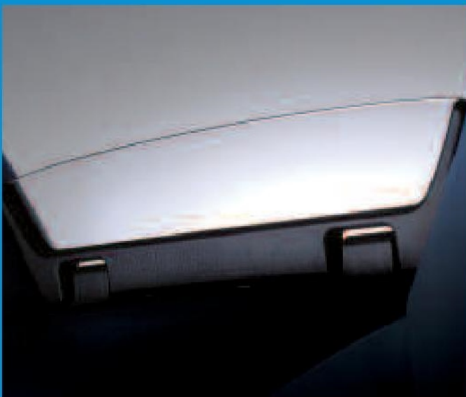
Grâce au déflecteur escamotable installé entre les appuie-têtes, les turbulences dans l'habitacle sont réduites lorsque le véhicule est décapoté.