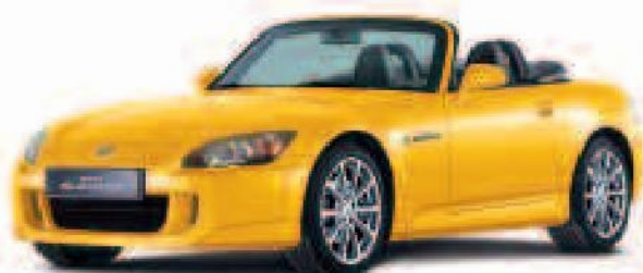
Nouveau Jaune Indy