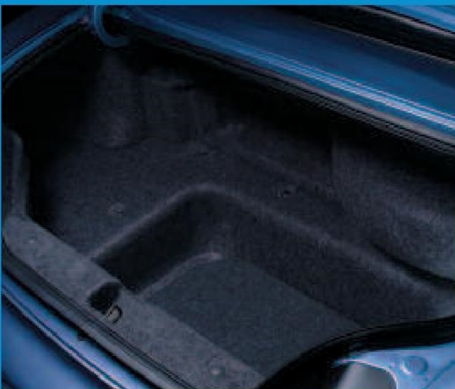
Bien que la S2000 soit un roadster compact, vous serez surpris par le volume utile du coffre, bien plus généreux que ce que vous auriez pu imaginer.