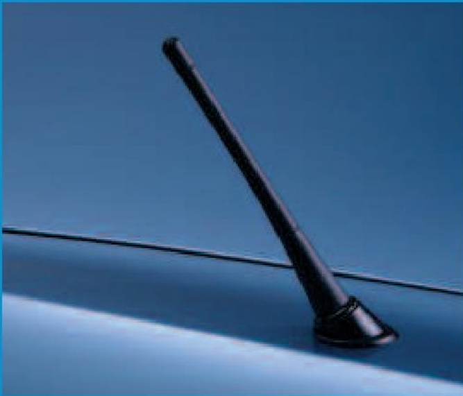
L'antenne flexible confère une excellente qualité de réception au système audio CD.