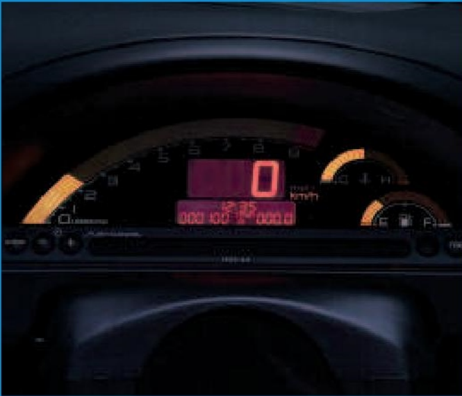
Les instruments du tableau de bord de la Honda S2000, à cristaux liquides, sont d'une lisibilité parfaite.