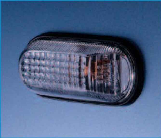
Les répéteurs de clignotants sont positionnés en hauteur sur le flanc de la Honda S2000. Ils sont traités dans un coloris neutre, afin de s'intégrer aux lignes harmonieuses de la voiture.