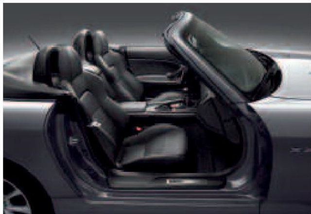
Cuir noir disponible avec toutes les couleurs extérieures sauf le Bleu Nürburgring.