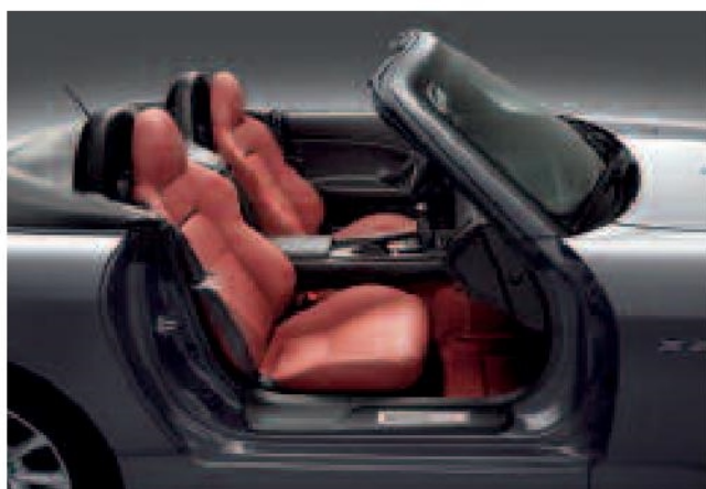
Cuir rouge disponible avec les couleurs Noir Berlina, Gris Lunaire, Bleu Océan et Burgundy.

La Honda S2000 est disponible avec une gamme étendue de couleurs. Tous les intérieurs sont confectionnés avec la plus grande application et utilisent des cuirs de haute qualité. Les finitions aluminium et chrome rehaussent cette ambiance résolument haut de gamme et sportive.