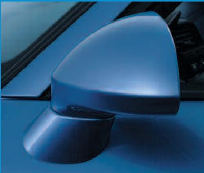
Vous allez aimer conduire la Honda S2000 même si le soleil n'est pas au rendez-vous. Les rétroviseurs extérieurs dégivrants vous assurent une excellente visibilité.