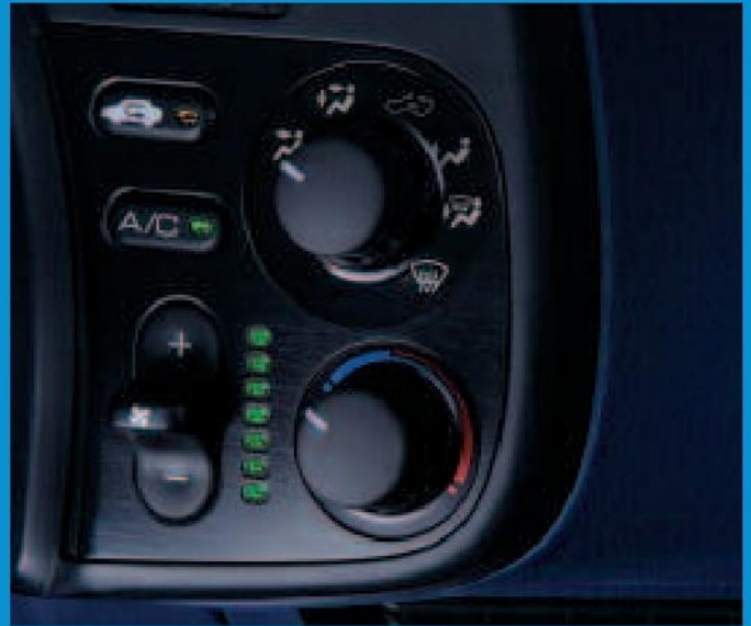
Lorsqu'il n'est pas possible de rouler avec le toit ouvert, vous pouvez utiliser l'air conditionné pour maintenir l'habitacle à la température désirée.