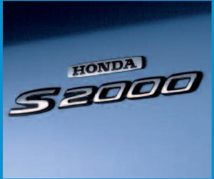
Ce logo chromé ajoute au "look" extérieur et à la personnalité affirmée de la voiture.