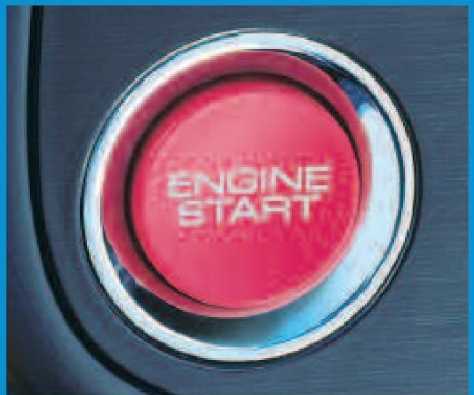
Démarrage du moteur par un bouton-poussoir, comme en compétition.