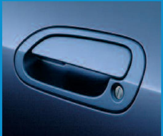
Les poignées peintes dans la couleur de la carrosserie sont subtilement intégrées aux portières, ajoutant ainsi à la fluidité de la silhouette.