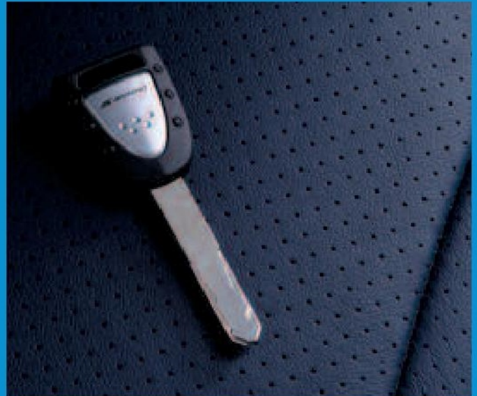
Encore plus de sécurité anti-vol avec la nouvelle clé de contact "type vague". Le système d'anti-démarrage, fonctionne avec un code tournant à chaque insertion de la clé.